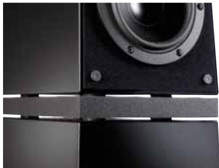
Eine dicke MDF-Scheibe und Schwingungen stark absorbierende Sorbothan-Scheiben trennen die Gehäusemodule voneinander