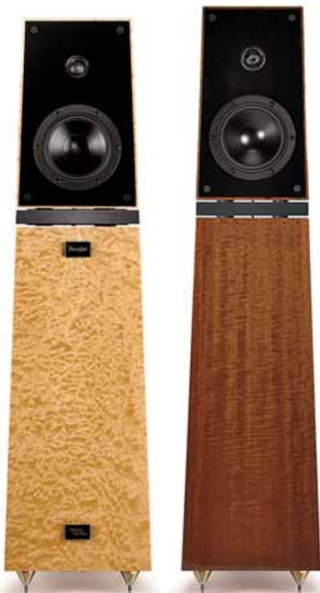
Veritys neue Leonore (M.) – hier mal mit mehrfach lackierter Holzoberfläche – mit ihren konzeptionell sehr ähnlich aufgebauten Nachbarmodellen Parsifal Ovation (I.) und Rienzi

tels einer dicken Zwischenplatte sowie Sorbothan-Dämpfern, die gemeinsam mögliche Interferenzen unterbrechen oder einfach schlucken sollen. Bei der Parsifal Ovation ist's ebenso, wobei anders als dort die beiden Teile der in stabilen Holzkisten gelieferten Leonore miteinander verblockt sind, also eine feste mechanische Einheit bilden.