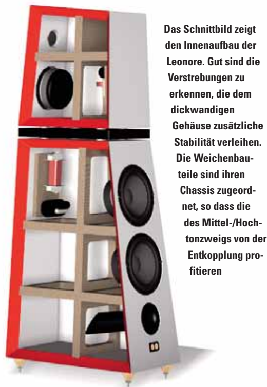
Das Schnittbild zeigt den Innenaufbau der Leonore. Gut sind die Verstreben zu erkennen, die dem dickwandigen Gehäuse zusätzliche Stabilität verleihen. Die Weichenbauteile sind ihren Chassis zugeordnet, so dass die des Mittel-/Hochtonzweigs von der Entkopplung profitieren

STICHWORT Aufbrechen: Oberhalb einer bestimmten Frequenz schwingt die Membran eines Töners nicht mehr gleichförmig, was Verzerrungen erzeugt.