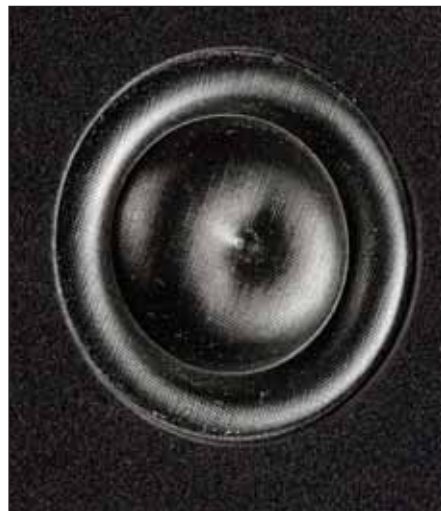
Keine Angst, niemand hat hier den Hochtöner eingedrückt. Die mittige Delle ist Teil der Form des phantastisch auflösenden Ringstrahlers

Einleuchtend ist das ja, aber funktioniert es auch in der Praxis so wie in der Theorie? Und ob, dabei ist die Leonore nichtmal aufstellungskritischer als andere Boxen. Fast schon langweilig, dass sie exakt dort ihren Lieblingsplatz fand, wo auch ihre Kolleginnen am besten klingen. Sollten die tiefen Lagen anfangs noch ein gewisses Eigenleben führen und der Lautsprecher untenherum tendenziell füllig und etwas träge daherkommen, so ist er einfach noch nicht richtig eingespielt. Während unserer ausgiebigen Tests, wobei sich Genuss und das nüchterne Abklopfen von Qualitäten oft kaum voneinander trennen ließen, war zu beobachten, wie die Bässe sich allmählich immer nahtloser an die