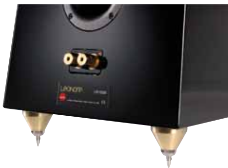
Die Leonore steht – ganz Dame – auf Highheels, soliden Metallkegeln, in deren Spitzen sich Spikes einschrauben lassen