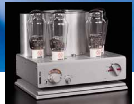
Die Endstufen-Version 300p – hier ohne Glastuben – kommt mit weniger Bedienelementen aus

Und ein absolut zeitloser dazu. Denn der rund 14 Kilogramm schwere 300i – ohne Fernbedienung, Lautstärke- und Balanceregler sowie Eingangsumschaltung auch als Stereo-Endstufe 300p (um