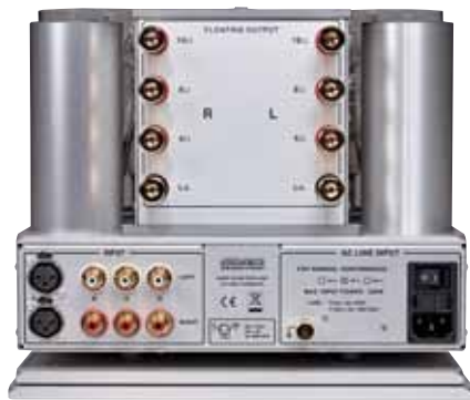
Auf der Rückseite gibt es neben den vier Eingängen eine zusätzliche Erdungsbuchse sowie einen Netzhauptschalter

Ansonsten benötigt der 300i keinerlei Aufmerksamkeit, obgleich alle Blicke natürlich immer an dem optisch reizvollen, im für Nagra typischen Spannungsfeld zwischen technischer Coolness und knuddeliger Niedlichkeit gestalteten Geräten hängen. Von der Soft Start-Automatik beim Einschalten bis zur diskreten Überwachung der Kreise wurde auf höchste Betriebssicherheit geachtet. Selbst unter maximaler Belastung während der Leistungsmessung im La-